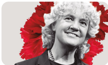
MAYTE MARTÍN Flamenco Íntimo / 25 MAYO - 20:00 H.