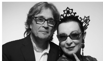
MARTIRIO Y CHANO DOMÍNGUEZ TRIO