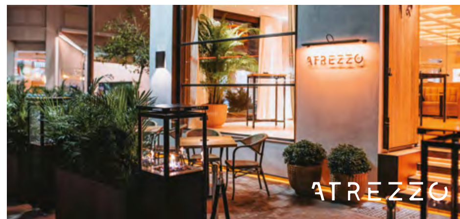
Cocina tradicional italiana.