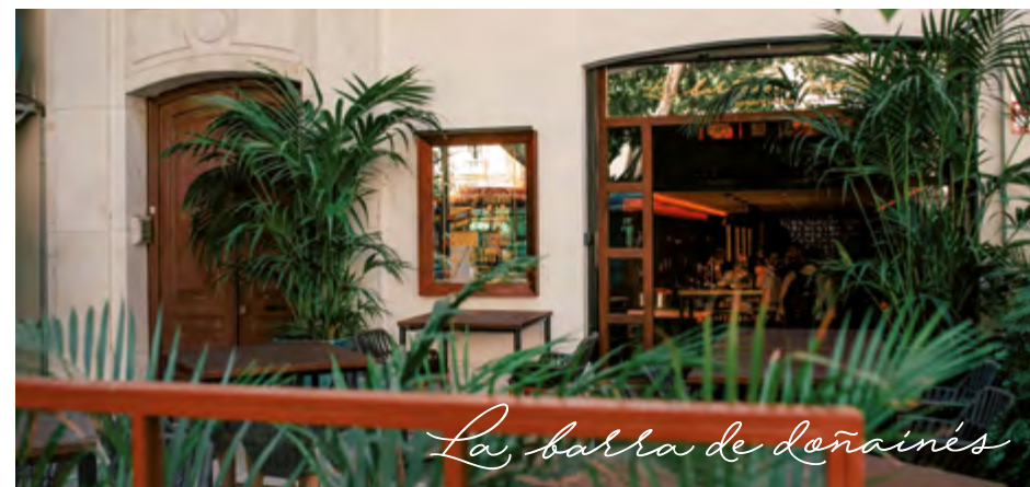
Taberna con pequeñas porciones de cocina tradicional mediterránea.