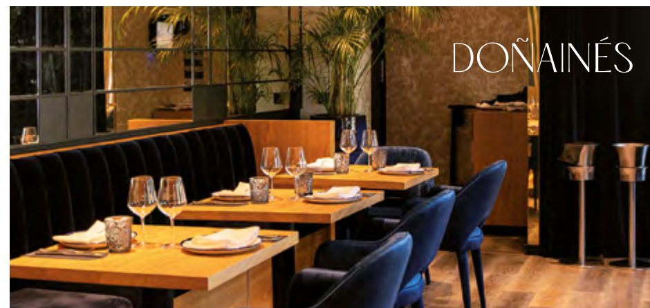
Cocina tradicional mediterránea con un toque vanguardista.

El restaurante Tercer Acto es un espacio gastronómico que comunica directamente con el Teatro del Soho CaixaBank, es un gran rincón de ocio en el barrio del Soho. Ideal para organizar tertulias, reuniones o presentaciones en su sala privada y disfrutar de su exquisita carta de cócteles así como de su deliciosa propuesta culinaria.